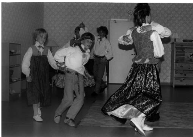
Deltagare i Jösse Hallingbreakers.

– Jag använder musiken och naturen för att bli frisk.