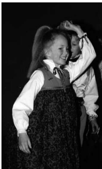
Deltagare i Jösse Hallingbreakers.

om kropparna inte tar upp den. Jag bryter upp dansen. Jag använder den folkliga dansen som material. Utgångspunkten är ofta pardanser, men det är sällan som jag har pardanser på scen. Man dansar ensam, men har steg från polska och halling. Sedan är det ibland så att jag vill berätta något i dans då behövs en mer medveten koreografi.