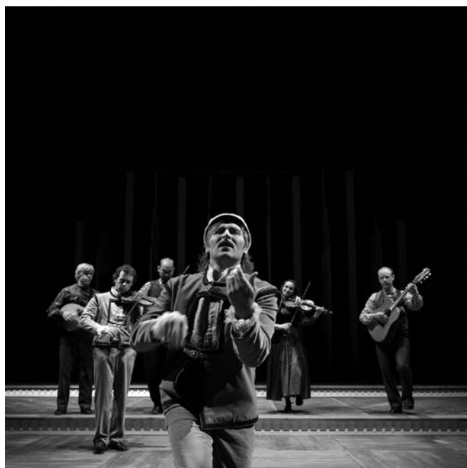
Ur En Herrgårdssägen.

Den 24 juni 2008 har Västanå Teater premiär på "Bannlyst" av Selma Lagerlöf i den stora Berättarladan i Sunne. Pjäsen spelas till 31 augusti. Beställ biljetter på www.vastanateater.se .