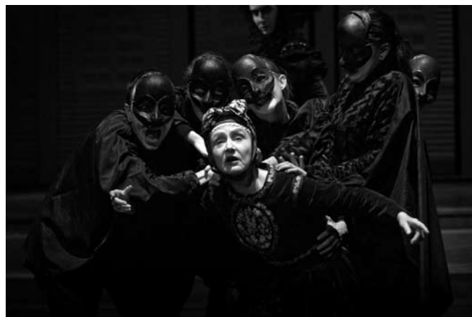
Ur En Herrgårdssägen .

2008-03-11 19:00 Gävle, Gävle Teater 2008-03-14 19:00 Avesta, Avesta teater 2008-03-15 19:00 Enköping, Joar Blå 2008-03-17 19:00 Ludvika, Avenyteatern 2008-03-18 19:00 Karlskoga, Stadsteatern f.d. FH 2008-03-26 19:00 Oskarshamn, Forum 2008-03-27 19:00 Kalmar, Kalmarsalen, Romanhallen 2008-03-28 19:00 Karlskrona, Konserthusteatern 2008-03-30 19:30 Osby, Borgen, Scenen 2008-04-01 19:00 Lund, Lunds Stadsteater 2008-04-02 19:00 Halmstad, Halmstad Teater 2008-04-06 18:00 Trollhättan, Hebeteatern 2008-04-07 19:30 Vara, Vara Konserthus, Stora salen 2008-04-08 19:00 Skövde, Stadsteatern 2008-04-10 19:00 Örebro, Hjalmar Bergmanteatern 2008-04-12 19:00 Ytterjärna, Kulturhuset, Ytterjärna 2008-04-13 18:00 Linköping, Konsert o Kongress 2008-04-14 19:00 Motala, Folkets Hus 2008-04-16 19:00 Hässleholm, Kulturhuset 2008-04-18 19:00 Ystad, Ystads teater 2008-04-19 19:00 Ystad, Ystads teater 2008-04-21 19:00 Eskilstuna, Eskilstuna Teater