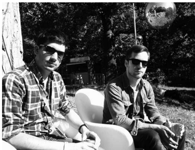
DJ-duon Logo.

förlöpa på följande sätt. Personen följer försiktigt musiken i dess upptrappning, väntar in basen och lämnas därefter över i famnen på euforin. Rent fysiskt brukar det bli en del gestikulerande händer i luften, axelryckande och ibland helt oväntade rörelser. Publiken måste explodera i laddad stämning, het atmosfär, sätta fart på de svärdansade, och få skivorna att lukta svett för att Logo nöjt ska kunna stiga av scenen.